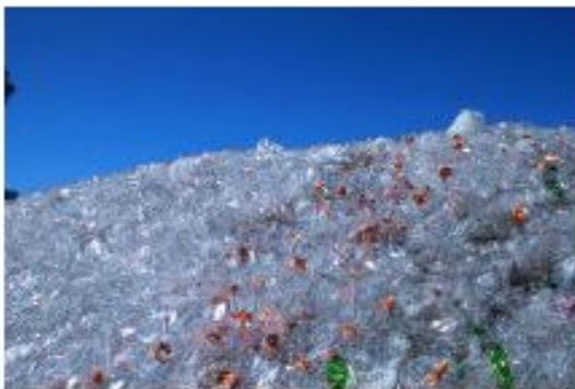
VIDRIO ALMACENADO PARA SU RECICLAJE.

En la energía renovable se emplea la fuerza del viento (eólica), del agua (hidráulica), la radiación del sol (solar)