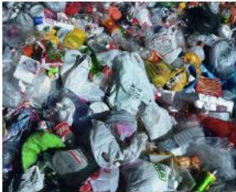
LAS BASURAS SON UNA FORMA DE CONTAMINACIÓN.

De todos los contaminantes , podemos destacar los metales pesados, ya que son muy perjudiciales para los seres vivos y, además, son de los que poseen una mayor persistencia en el medio en el que se depositan.