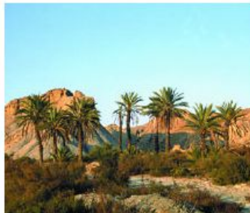
LOS DESIERTOS PRESENTAN UNA BAJA BIODIVERSIDAD.

El término que alude a la variedad de seres vivos diferentes que viven en un territorio determinado se denomina biodiversidad . Este término puede describirse desde el punto de vista de los genes, de las especies y de los ecosistemas.