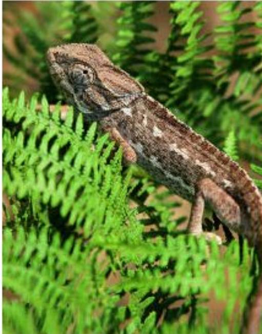
ELEMENTO DE FAUNA.

gar al que se han adaptado se le denomina hábitat .