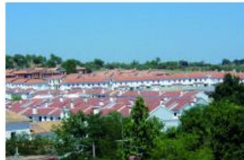
EL ENTORNO URBANO FORMA PARTE DEL MEDIO AMBIENTE.

El medio ambiente es el compendio de valores naturales, sociales y culturales existentes en un lugar y un momento determinado, que influyen en la vida material y psicológica del hombre y en el futuro de generaciones venideras.