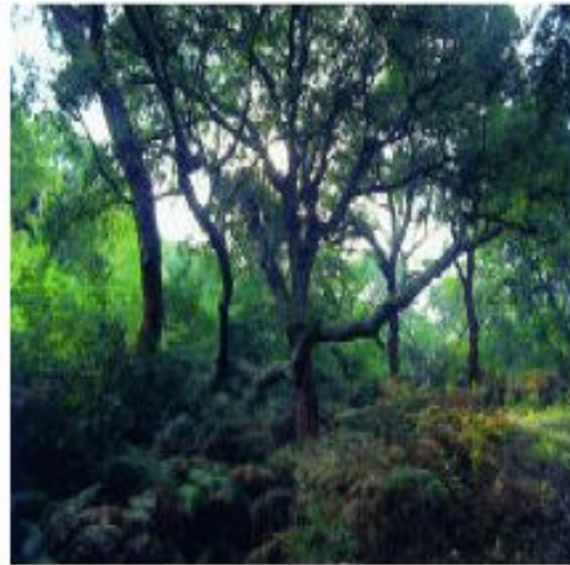
UN BOSQUE ES UN ECOSISTEMA CON MUCHAS ESPECIES DISTINTAS. ES, POR TANTO, MUY DIVERSO.

bajo debido a las condiciones tan duras que allí se dan. Por el contrario, en otros como las selvas el número de especies se cuenta por cientos de miles.