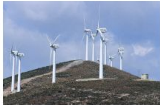
EL VIENTO ES UNA FUENTE DE ENERGÍA INAGOTABLE.

o el poder calorífico de la materia orgánica (biomasa).