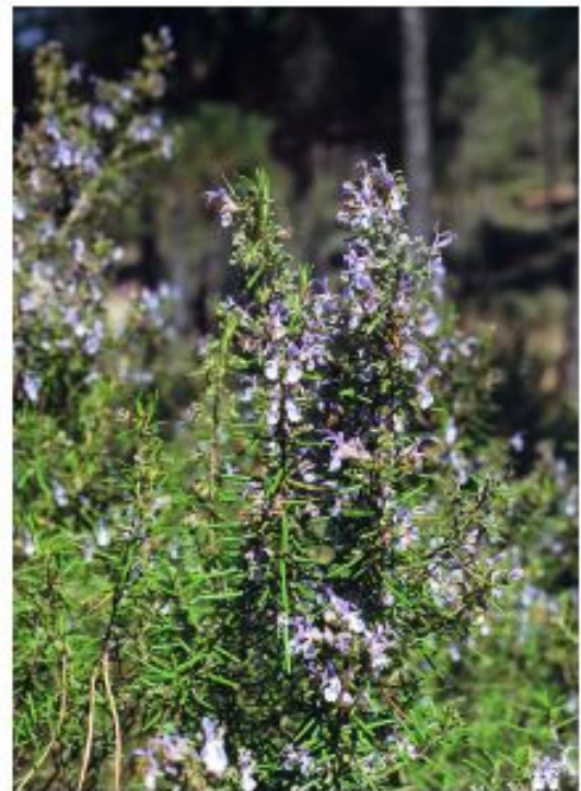
ELEMENTO DE FLORA.

Nos referiremos a la flora de un lugar como el conjunto de especies de plantas que allí viven.