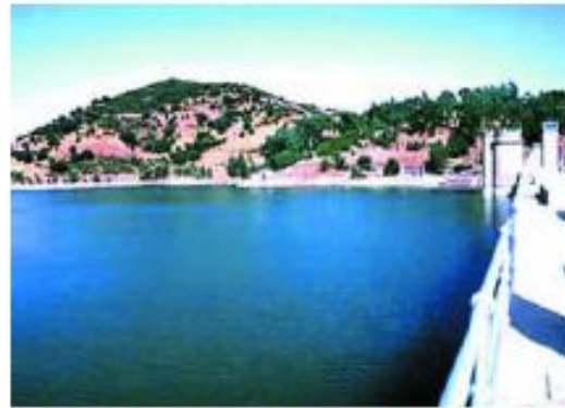
LA CONSTRUCCIÓN DE UNA EMBALSE SUPONE UN CAMBIO DEL HÁBITAT DONDE SE UBICA.

calefacción o el calor desprendido por los coches provocan un aumento en la temperatura de las ciudades en dos o tres grados respecto a sus alrededores. Esto permite que animales como algunos insectos se desarrollen mejor en las ciudades que fuera de ellas.