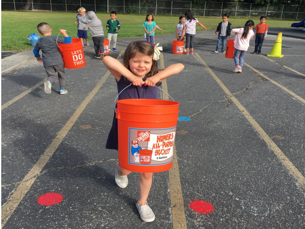
El Move-A-Thon de Laurel es un gran éxito!

El 14 de septiembre Laurel Elementary realizó su Move-A-Thon anual para la comunidad escolar. Todos los estudiantes se movían al ritmo mientras participaban en estaciones de acondicionamiento físico en todo el campus de Laurel. Este año, Move-A-Thon recaudó $75,000 que beneficiarán a programas como educación física, Arte en Acción, Día del Arte y la Ciencia, Semana de la Alfabetización, asambleas, excursiones y ¡MÁS! ¡Gracias a nuestras generosas familias de Laurel por apoyar a nuestra escuela!