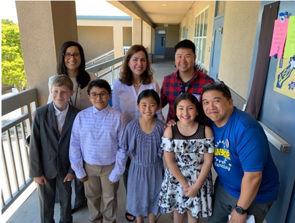
Diane Papan, alcaldesa de San Mateo

¡Gracias a la alcaldesa de San Mateo, Diane Papan, y su personal por visitar Sunnybrae Elementary y contestar las preguntas de nuestros alumnos acerca de lo que San Mateo está haciendo para manguar los efectos del cambio climático y el calentamiento global!