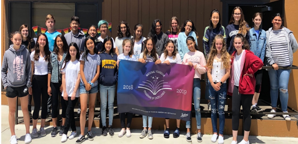
Personal del anuario de Bowditch

¡Felicidades a la clase del anuario de Bowditch Middle School por haber ganado por segundo año consecutivo el Premio de Excelencia del Programa Nacional de Anuarios Jostens! Este premio es otorgado a menos del 10% de todas las escuelas Jostens en todos los Estados Unidos. Nos sentimos muy orgullosos de esta clase tan trabajadora por haber creado un anuario sin igual para el 50avo aniversario de Bowditch.