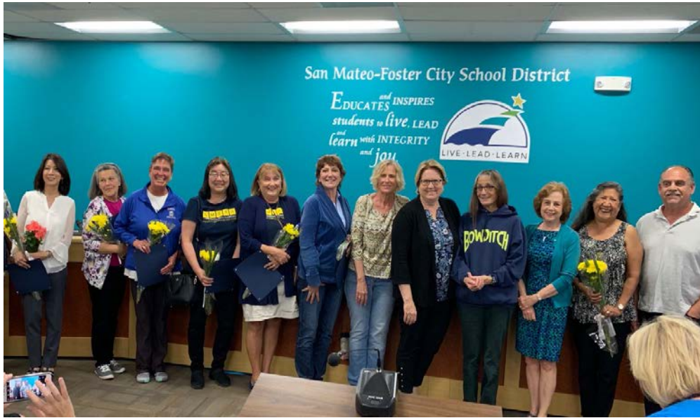
Jubilados del 2019 de SMFCSD

¡Felicidades a los jubilados de SMFCSD! Gracias por sus muchos años de servicio para nuestros niños y nuestra comunidad. ¡Les deseamos lo mejor!