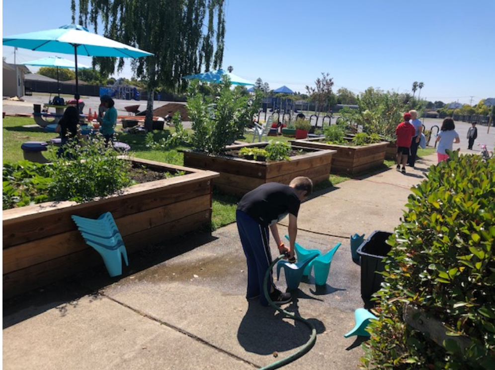
Embellcimiento de George Hall

Cientos de voluntarios participaron en el día del embellecimiento de George Hall Elementary's esta primavera! En total, completamos 16 proyectos y subproyectos (o avanzamos significativamente en el trabajo) incluyendo: