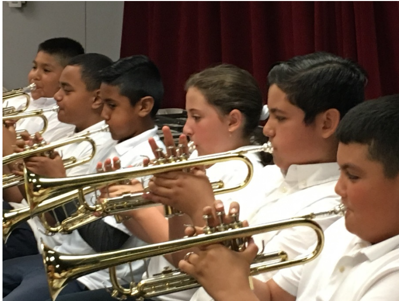
Concierto de música de 5º grado de la Escuela LEAD

¡Felicidades y muchas gracias a nuestros maravillosos músicos y maestros de 5º grado! Esperamos que muchos de ustedes hayan disfrutado de los conciertos del 5º grado que se llevaron a cabo en mayo. ¡Es asombroso lo que nuestros niños pueden lograr con tan sólo un año de clases de música!