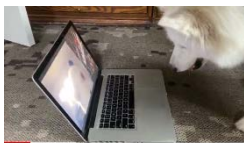
Virtual Therapy Dog Visit #3: Back to School!

Buenos días Sayreville. Espero que hayas tenido un fin de semana agradable. Asimismo, esperamos que todas nuestras familias judías hayan tenido un Rosh Hashaná bendecido. Por favor recuerde que este viernes 25 de septiembre no habrá horario de oficina para que nuestro personal pueda participar en el desarrollo profesional. Asimismo, tenga en cuenta que a partir de mañana realizaremos nuestra primera Semana virtual de Regreso a Clases . Como parte de esto, cada escuela publicará una presentación en video en su página web, cubriendo los mismos temas que normalmente harían durante sus presentaciones en vivo de la Noche de Regreso a la Escuela cada año. Más importante aún, cada maestro de cada escuela creará una presentación en video y la publicará en su página web individual de Oncourse. Los padres podrán acceder a estas páginas web el martes 22 de septiembre a través del Tablero en OnCourse Connect desplazándose hacia abajo hasta la sección Calificaciones 2020-21 y presionando el nombre del maestro , que estará en fuente azul . Además, cada página web de la escuela incluirá un enlace rápido para acceder a las páginas web de los maestros.