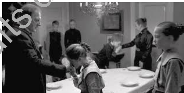
Aus dem Film von Haneke, das weiße Band .

Der Film " Das weiße Band " spielt im Jahre 1913 und thematisiert die strengen Erziehungsmethoden in einem Dorf in Norddeutschland. Mit diesem Film gewann Michael Haneke die goldene Palme in Cannes 2009.