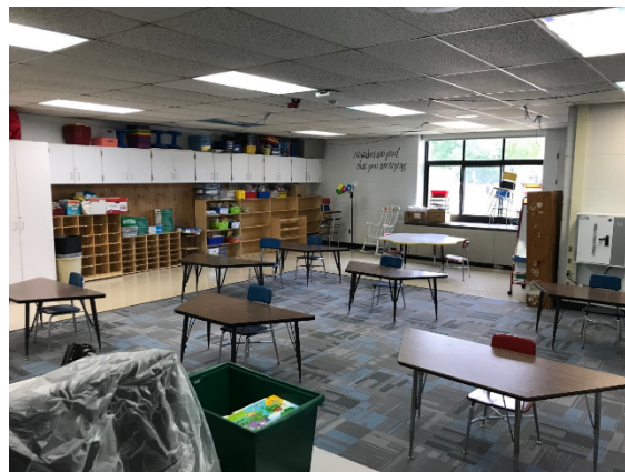
Figura 2 Klasa fillore

Disa klasa fillore kanë vende pune që janë të përbashkëta me dy ose më shumë studentë. Do të punojmë me klasat për ta përdorur sa më mirë hapësirën e disponueshme, duke shkëmbyer mobilet për të ndihmuar sa më shumë në distancimin fizik mes studentëve: