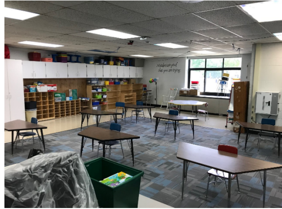
Figura 2 Aula de primaria

Algunas aulas de primaria tienen estaciones de trabajo que se comparten entre dos o más estudiantes. Trabajaremos con aulas individuales para aprovechar al máximo el espacio disponible, incluido el intercambio de muebles para acomodar mejor la distancia física entre los estudiantes: