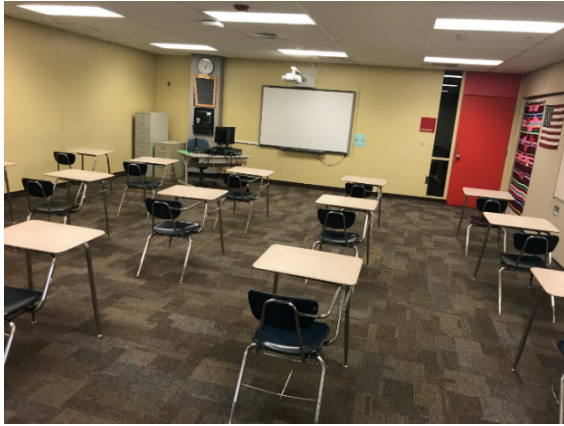
Figura 1 Aula de secundaria