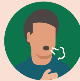
FALTA DE AIRE