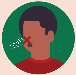
PÉRDIDA DEL GUSTO O DEL OLFATO

If your child tests positive for COVID, do not send them to school until you speak with public health to find out how long your child should stay home.