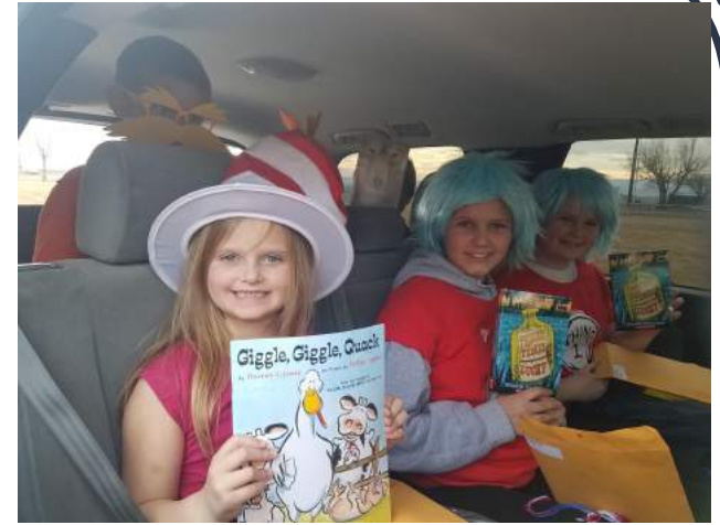
Dr. Seuss Week & Classified Appreciation Week