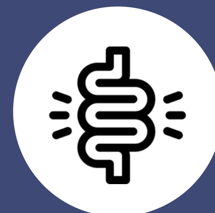
Náuseas, vómitos o diarrea