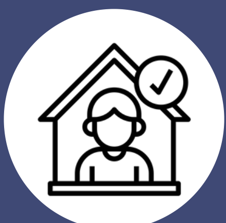
Quédese en casa y póngase en cuarentena