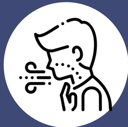
Dificultad para respirar