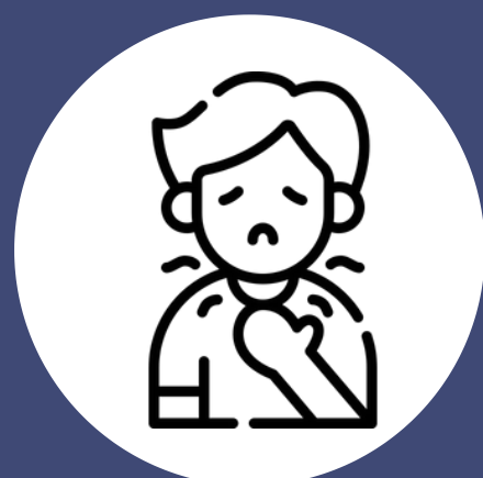
Dolor de garganta