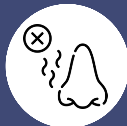
Pérdida del gusto o del olfato