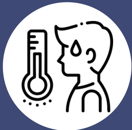
Fiebre de 100°F o superior