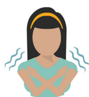
fever or chills fiebre o escalofríos