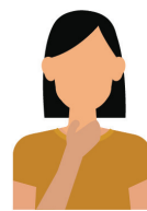
sore throat dolor de garganta