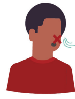
Runny nose, congestion or recent loss of smell or taste congestión nasal, pérdida reciente del olfato o del gusto