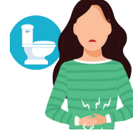
Nausea, vomiting or diarrhea Náuseas, vómitos o diarrea