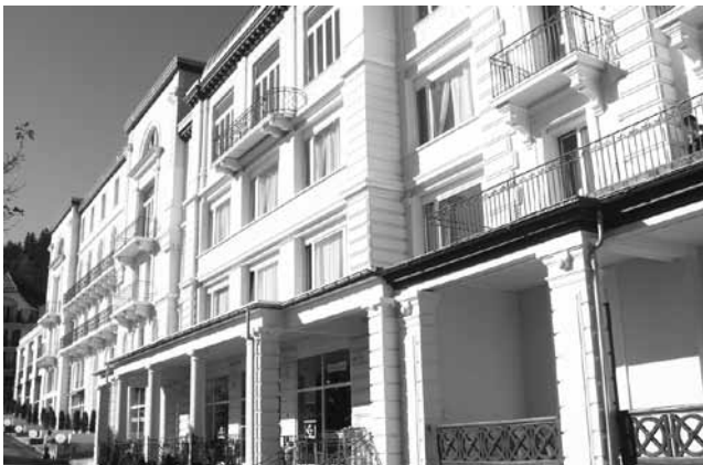
図2-④ Hotel du Mont-Blanc。SHMS が2004年に改修後、経営を開始。(2014年11月、筆者撮影)

レザン・キャンパスでは、SHMS はさらに1.2で言及した1894年建築の Hotel du Mont-Blanc (図2-④) も取得・改修している。このホテルと前述の Le Belvédère は、道路を挟んで標高差がある位置に立っていることから Sky Train というケーブルで結ばれている。Le Belvédère と Hotel du Mont-Blanc はそれまでヴァカンス用のホテルとして細々と営業されていたものの、この SHMS の事業展開により、大きなホテルスクールとして再び脚光を浴びることになる。2014年10月に筆者が行ったインタヴュー調査によると、在籍学生数が720人という規模にまで達している。学生の80%をアジア系が占めている。