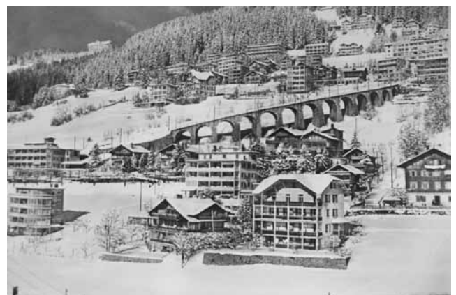
図1-⑤ 1910年頃のレザンの風景。(Leysin,)