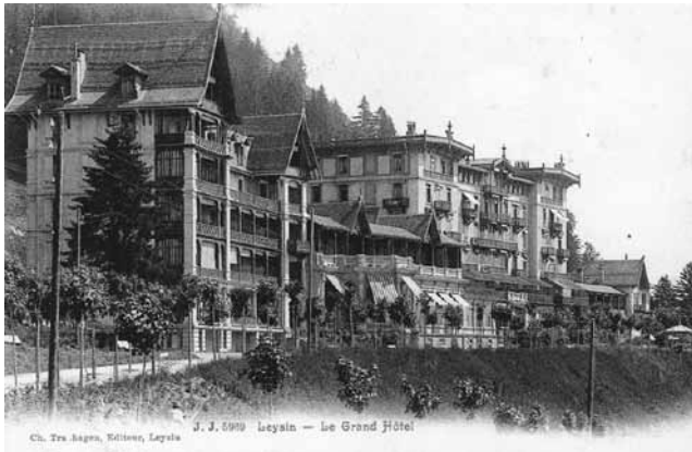
図2-① 1908年当時の Grand Hotel. (ポストカード)

経済的に恵まれた人々やその関係者、医療関係者、そして地元の商業関係者たちは豊かで文化的な生活を送っていたことがうかがえる。平和で文化的な生活を享受したベルエポック (Belle Époque) の時代 11 であり、1892年に誕生した豪華な Grand Hotel はその象徴ともなっている (図2-①)。