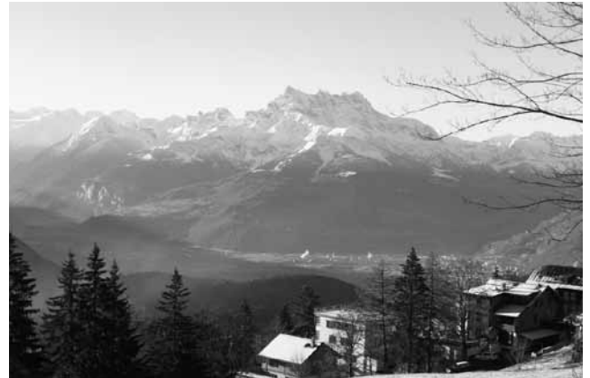
図1-② レザン市から渓谷の町を望む。(2014年10月)

しばしば眼下に雲が発生する。それはローヌ渓谷を覆い尽くしてしまい、雲の上にこの集落は浮いてくる。そしてそこは溢れるほどの太陽の光の中に置かれる (図1-②及び③)。それゆえ、下界と雲上とではそれぞれの気候条件が人々の心身の健康に及ぼす影響が顕著であり、それは徐々に明らかになってくる。