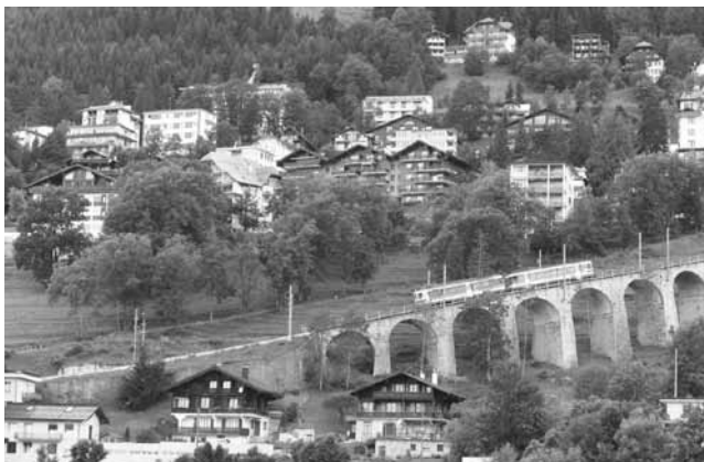
図1-④ 1897年開通の登山鉄道。Leysin-Aigle 間を結び、(2014年10月、筆者撮影)

1820年代の終わり頃になると下界の子供たちが、患っていた「くる病」の治療のためにレザンに上がってくるようになる。降り注ぐ太陽光線により、その症状の軽減と回復を願ったものである。欠乏しているビタミンDが子供たちの体の中に形成されることによりこの病気の治療ができると期待されたのである。こうなると、レザンへのそれまでの急峻な山道に代わってよりアクセスしやすい道路の建設が求められる。1837年に、ほぼ標高1,000m地点の小さな集落 Sépey までの道路ができ、1875年にはついにレザンと眼下にある渓谷が結ばれている。これによりレザンは渓谷地方とスイス国内、ヨーロッパ、そして世界と結ばれることになる。1897年には基幹鉄道が走る下界の町 Aigle と Leysin 間を往復する登山鉄道が開通する。こうした発展期を経てレザンは国際的に認知されるようになり、ヨーロッパ全域から徐々に人々が訪れるようになってくる。この登山鉄道はその後、1915年には Leysin-Feydey 駅からさらに上り、後述する標高1,450m 地点に1892年に建築されていた Grand Hotel まで延長される。このホテルから直接終着駅に出入りできるようになり、世界とレザンのホテル・サナトリウム 10 が直接結ばれたことになる (図1-④)。