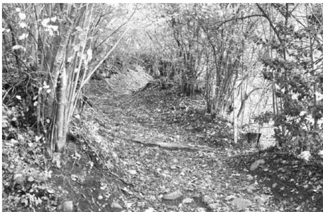
図1-① 140年前までレザンと渓谷の集落を接続していた唯一の山道。(2014年9月)

レザンは、集落の北側が山に守られ、南向きの台地に人々が住み始めた。北風から守られ、ローヌ渓谷からはまさに隠れ道のような細くて長い、急峻な山道があるのみである。下界からはほぼ孤立し、住民は自給自足の生活をしてきた。その山道は人が歩いてやっと通れるくらいの道である。140年前まで下界との接触を可能にしていたこの急こう配の道を、実際に筆者は歩いて渓谷の Aigle まで降りてみた。約2時間をかけて移動してみると、当時はさらに困難を極めたにちがいないであろうこの険しい道を人々は荷物を持って、時には小さなバと一緒を上り下りしていたことに驚かされる (図1-①)。