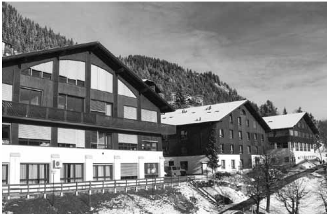
図2-③ この3棟のシャレーの左手にもう1棟女子寮のシャレーがある。(2014年11月、筆者撮影)

KLAS は創立当初、レザン内のホテルを改築して利用していたが、2年後には、スイス・アルプスのリゾートに最適のシャレーを3棟建設した。教室・事務室・食堂棟、女子寮、そして男子寮が完成して本格的な稼働を開始している。また、2000年には特別教室・多目的ホール用シャレーが完成した(図2-③)。こうした発展期を経てKLAS が生徒のために準備している教育プログラムは、その規模と教育効果において、日本国内はもとよりその他の日本の私立学校法人が海外で展開する国際教育を凌駕するものへと成長したのである。