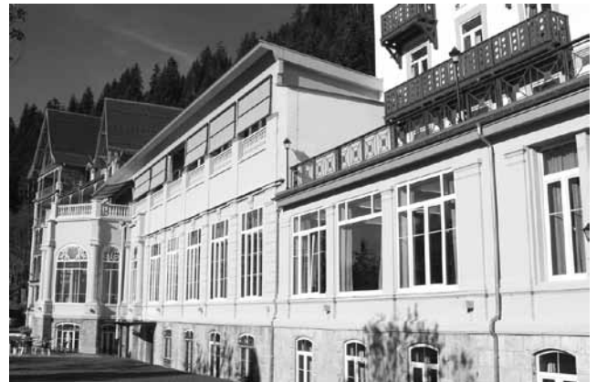
図2-② 1892年建築の Grand Hotel。2008年に LAS が取得、その後大改修。(2014年10月、筆者撮影)

ここから読み取れることは、IB 教育の拡大と強化を意図してレザンの歴史の中でも中核となる役割をはたしてきた Grand Hotel を獲得し、これを新たな起爆剤として一段レベルの高い国際教育の可能性を追求しようとしている。ここに集う生徒たちは、世界60か国以上からそれぞれの文化と生活様式を持って共同生活を送る。経済的にも社会的にも恵まれているこれらの生徒たちは、自国の各家庭にあれば豊かな環境の中で自由な日々を送っていたであろう。その若者たちが国際全寮制という学びの空間においてお互いの文化と価値観の相違を乗り越えながら成長すること、そしてかつて世界の注目を集めたこのレザンで将来のリーダーとしての準備をすることが期待されている。そのための国際全寮制学校の象徴として Belle Époque を獲得したことになる (図2-②)。