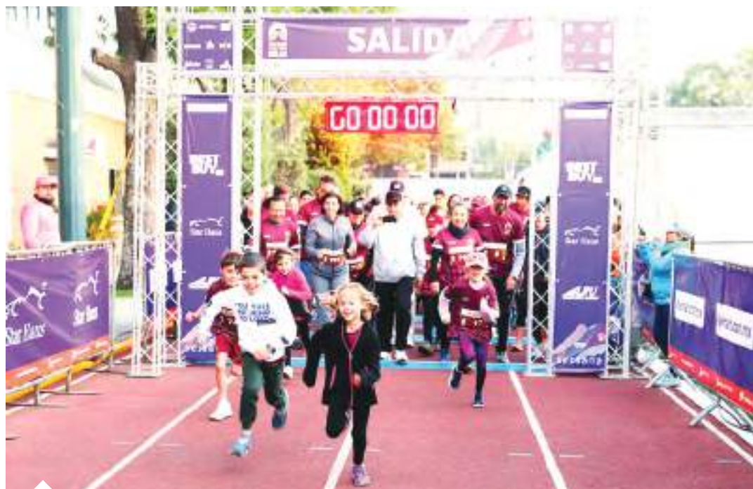
La diversión se vivió en familia