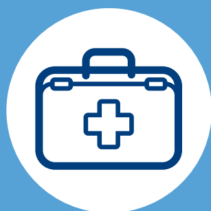
KIT DE PRIMEROS AUXILIOS