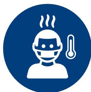
EVITE PERSONAS ENFERMAS

INFORMACIÓN + ACTUALIZACIONES: HEALTH.PA.GOV