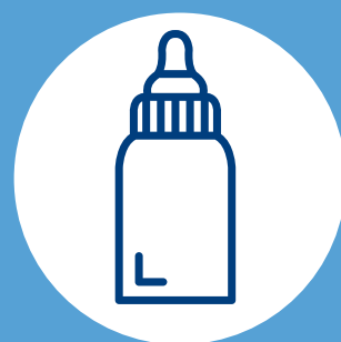
PROVISIONES PARA BEBÉS