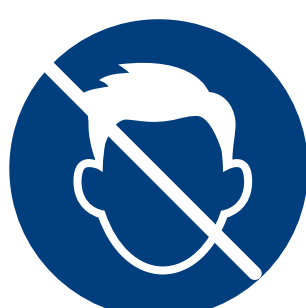
NO TOQUE SU CARA