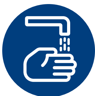
LAVE SUS MANOS