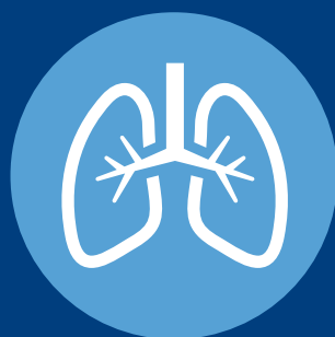
FALTA DE AIRE

SE PROPAGA A TRAVÉS DEL CONTACTO CERCANO