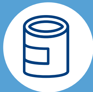
COMIDA NO PERECEDERA