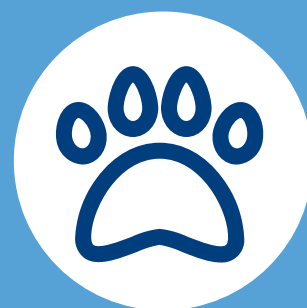
PROVISIONES DE MASCOTAS