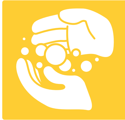
2. Use Soap Enjabónese