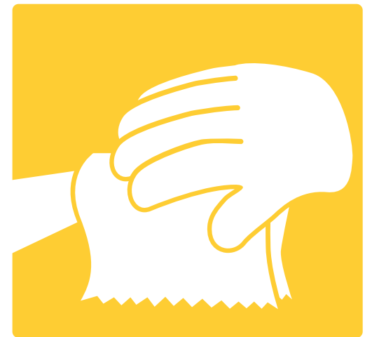
6. Turn off Water with paper towel Cierre el grifo usando una toalla de papel