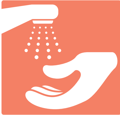
1. Wet your hands Mójeslasmanos