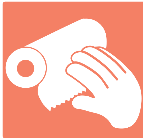
5. Dry Séquese las manos