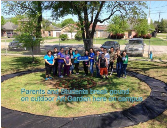
Parents and Students break ground on outdoor Art Garden here on campus

Creo firmemente que una de las funciones más importantes del arte y la educación artística es establecer conexiones entre nosotros y nuestra comunidad. En East End, nuestros estudiantes hacen esto aprendiendo cómo analizar el arte, criticar el arte y, por supuesto, hacer arte. Es crucial que nuestros estudiantes puedan mostrar su arte para cumplir su misión como estudiantes artistas.