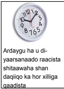
Ardaygu ha u diyaarsanaado raacista shitaawaha shan daqiiqo ka hor xilliga qaadista

Waa in dhammaan ardayda si cimilada ku habboon loogu soo labbisaa isla markaana ay diyaar u yihiin inay shitaawaha soo koraan shan daqiiqo ka hor jada-walka waqtiga qaadista . Shitaawayaashu joogsiga cidna kuma sugayaan xilliga qaadista kaddib; sidoo kalena shitaawuhu ma baxayo ka hor xilliga qaadista. Isku cuyubnaanta jadwalka shitaawayaasha ardayda curyaamada ah darteed uma saamaxayso waqti sugi-