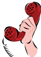
Fadlan soo wac mar walba oo uusan ilmahaagu shitaawaha raacayn.

Wadayaasha shitaawayaasha dugsiga waa khabiiriin xirfaddooda waxaana u weheliya tababar dheeraad ah iyo Shatiga Wadista Ganacsiga. Waxay u shaqeyaan Kilinka Dugsiyada. Iyagaa ka mas'uul ah nabadgelyada iyo habsami u qaadista ardayda iyo ku haynta jadwalkooda. Haddii aan kaaliye shitaawe jirin, wadaha ayaa xilkii kaaliyaha qabanayo. Kaaliyuhu wuxuu wadaha kala shaqeyaa sidii loo xaqiijin lahaa