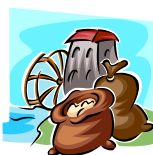
Moliendo Algodón Milling, Cotton Gin work