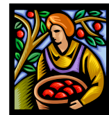
Verduras o camote Harvest of fruit and vegetables or sweet potatoes