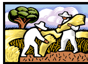
Cultivando, Preparando la tierra Cultivation, Preparation of Soil