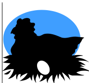
En la Pollera, Procesando, Empacando Poultry Processing, Packing