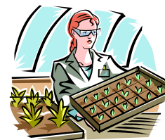
Viveros, plantando plantas, trabajando con la tierra Tree Planting, or cutting. Greenhouse, Nursery, Sod