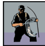
La Pesca, Procesando Pescado Fishing, Processing Fish