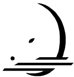
Con el ganado, Procesando, Empacando Feed Cattle, Processing

Encierre en un círculo los trabajos que haya hecho usted o alguien de su familia, (Please circle the jobs a family member or you have done):