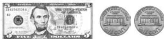
Cinco dólares y dos centavos