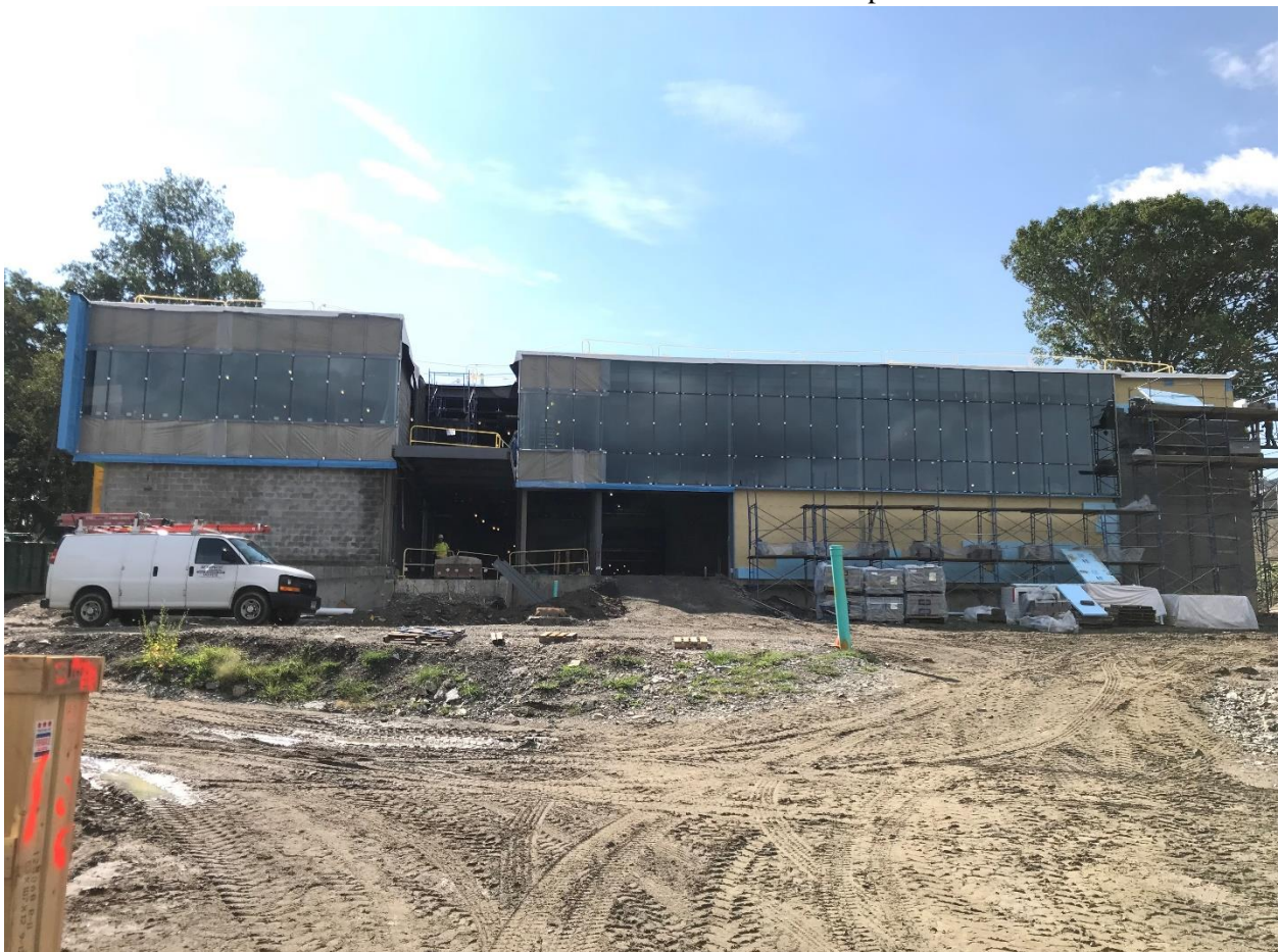
Fachada de la cara norte del edificio tomada el 19 de septiembre de 2018